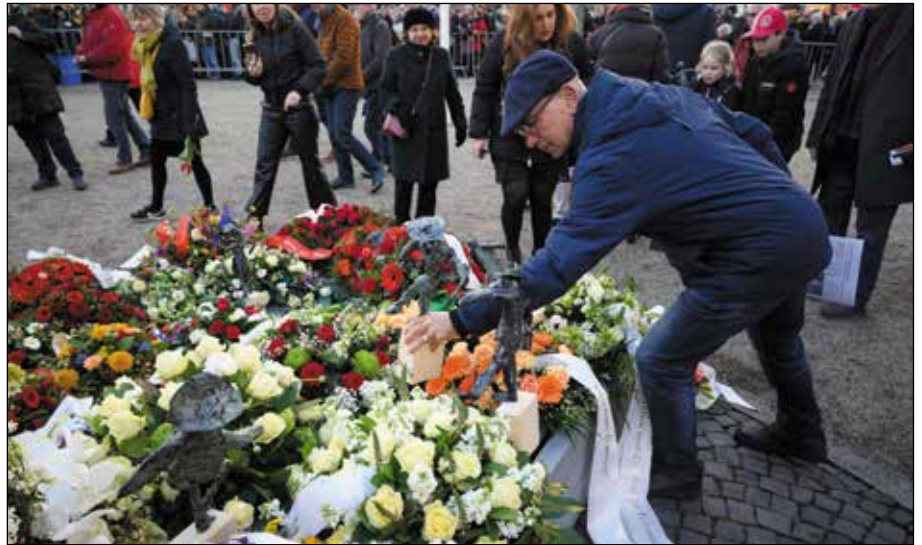
Zeer verzorgd werden ook vorig jaar prachtige bloemstukken bij de Dokwerker gelegd.

Het comité verzoekt iedereen om een klein bloemstuk, een enkele bloem of een kleinschalig alternatief te bestellen of mee te nemen, met het oog op de duurzaamheid. Bloemisten of uzelf kunnen dat op de dag zelf afgeven op het Jonas Daniël Meijerplein. Mensen die slecht ter been zijn, kunnen in deze tent een zitplaats vinden. In de tent wordt ook koffie of een ander drankje verstrekt. De herdenking begint om 16.45 uur. Na de bijdragen van de sprekers en optredens begint het defilé rond de Dokwerker. Aan het begin daarvan worden de kransen en bloemstukken gelegd bij het beeld. Daarna kan iedereen deelnemen aan het defilé en bloemen leggen. Niet alleen bij de Dokwerker, maar ook op andere plaatsen worden herdenkingen gehouden. Zo is op de zondag een herdenking in Weesp vanaf 15.00 uur en in de Amsterdamse Kinkerbuurt om 12.00 uur en in het stadhuis op het Waterlooplein om 15.00 uur. In Hilversum en in Zaandam wordt