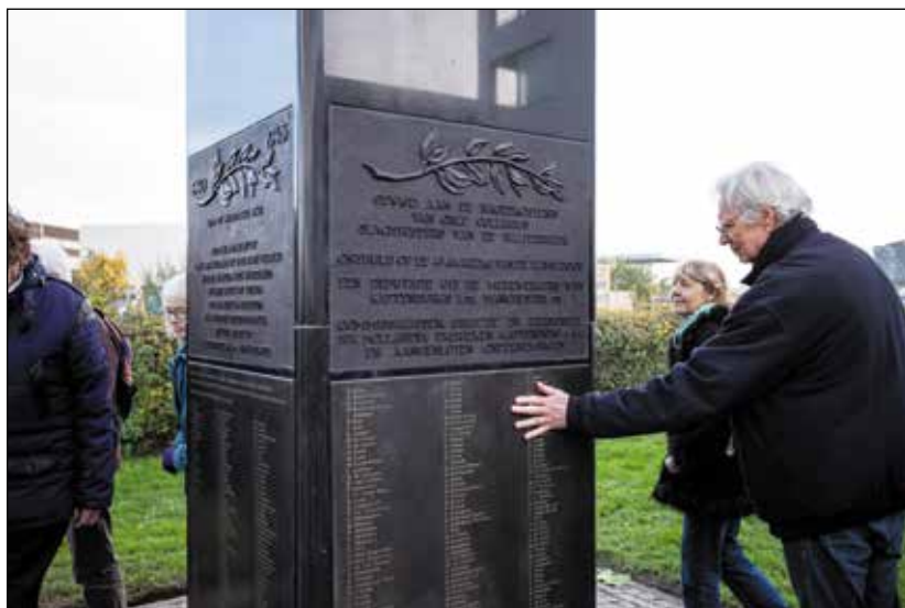
Elk jaar wordt in november een herdenking gehouden bij het monument op het IJ-plein voor de 826 omgebrachte Joodse werknemers van Hollandia Kattenburg en hun gezinnen.

Hollandia Kattenburg maakte textiel. De specialiteit was waterdichte regenkleding naar een procedé dat in Engeland was ontwikkeld. Het bedrijf gold als zeer modern en kon de vraag nauwelijks aan. Zowel de Bijenkorf als Hollandia hadden Joodse eigenaren. Om te voorkomen dat de nazi's hun bedrijven