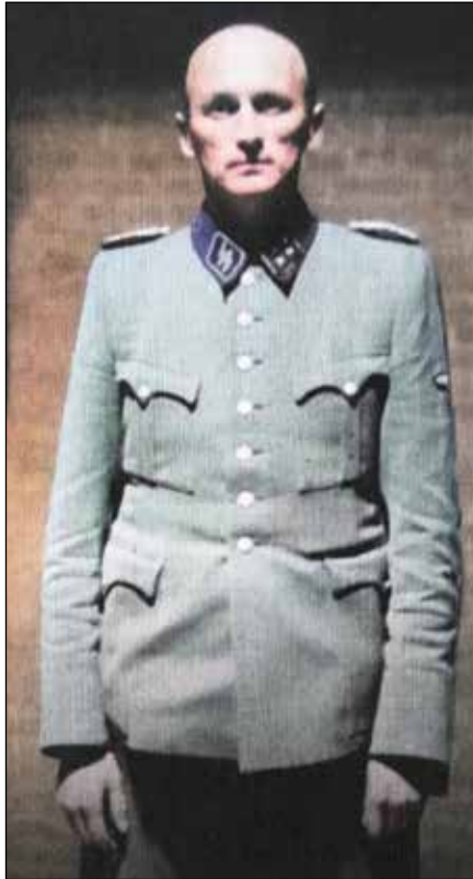
Willi Lages op de voorpagina van het boek van Sytze van der Zee

Na de oorlog, in 1951, noemde minister Hendrik Mulderije van justitie Lages 'een van de zwaarste oorlogsmisdadigers die tijdens de Duitse bezetting in Nederland oorlogsmisdrijven tegen de menselijkheid hebben gepleegd'. In iets meer dan een jaar werden 107.000 Joodse Nederlanders en vluchtelingen als ook zo'n 250 Roma en Sinti