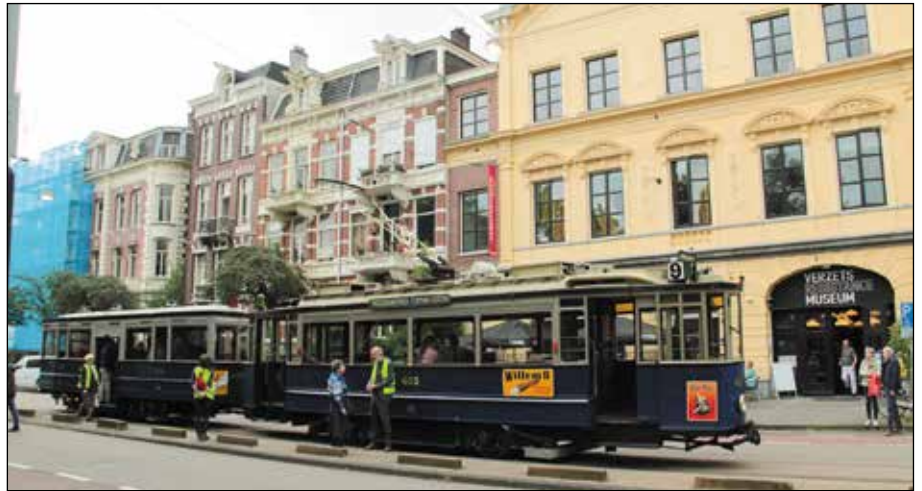
De Verzetstram voor het Verzetmuseum