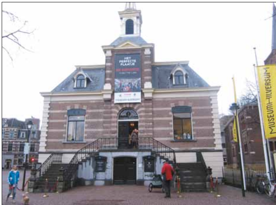
Het oude raadhuis van Hilversum (nu museum). Op het bordes stonden op 26 februari 1941 militairen met het geweer in de aanslag.