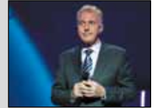
André van Duin

André van Duin gaat bij de herdenking enkele gedichten voordragen. Van Duin is Nederlands bekendste komiek en schitterde onlangs nog als acteur in de tv-serie 'Het geheime dagboek van Hendrik Groen'.