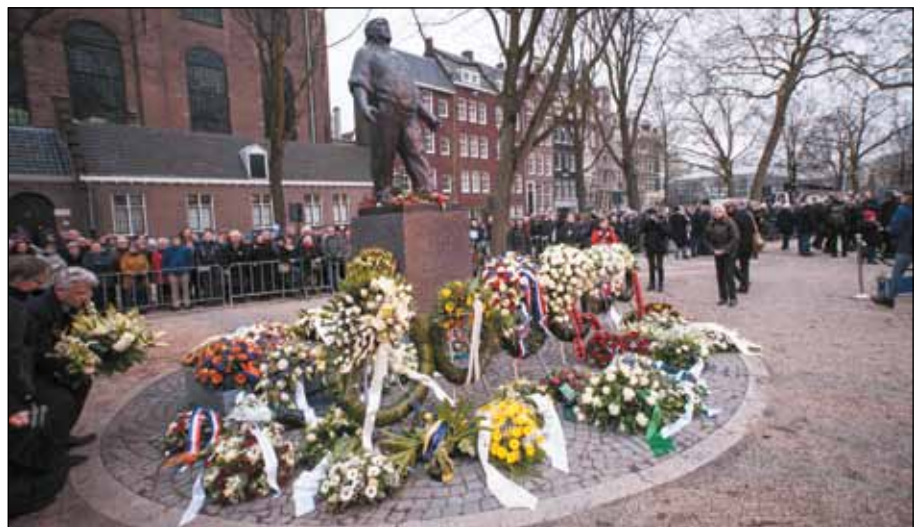
Beeld van de herdenking vorig jaar.