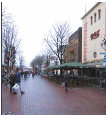
De Groest nu. Daar startte de betoging.